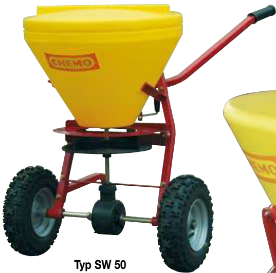
Typ SW 50