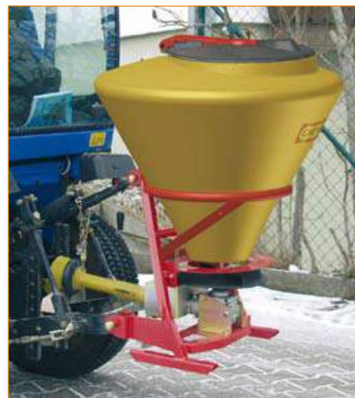
Typ SA 130