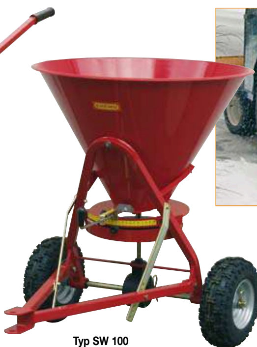
Typ SW 100