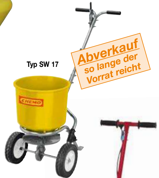
Typ SW 17