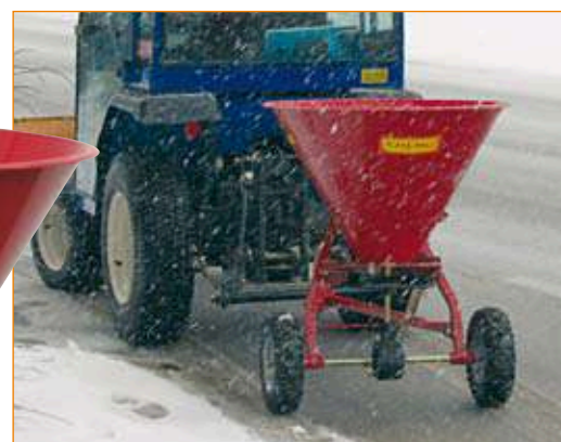
Typ SW 100