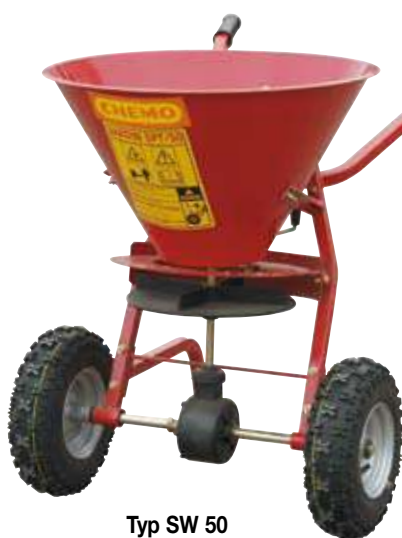
Typ SW 50