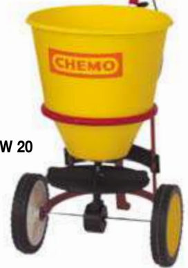
Typ SW 20