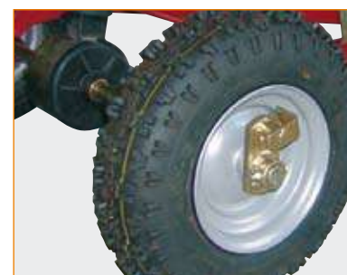
Abschaltbares Getriebe (SW 50, SW 100)