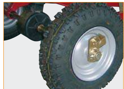
Abschaltbares Getriebe (SW 50, SW 130)