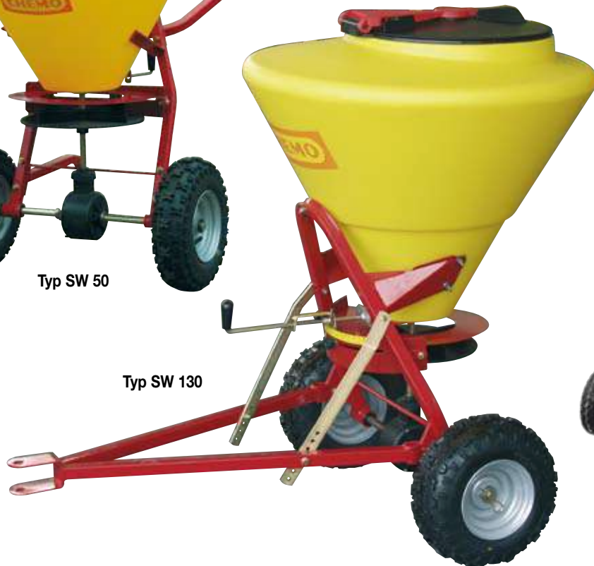
Typ SW 130